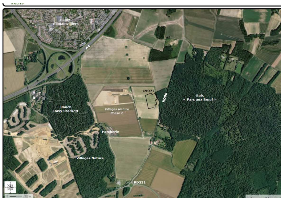
Situation du projet par rapport à Villages Nature